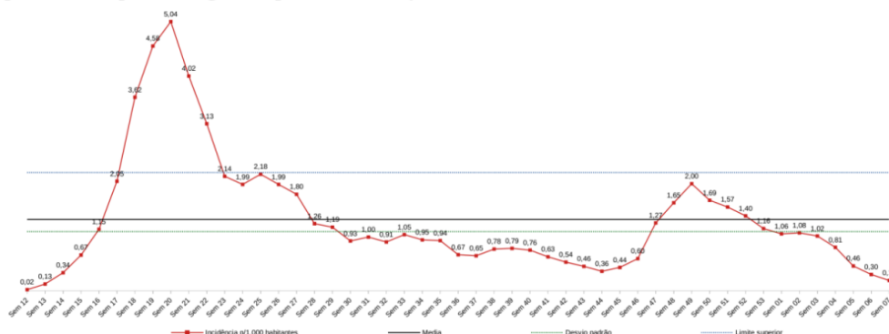
Figura 1 - COVID19 – Incidência de COVID19 p/1.000 habitantes, entre residentes de Queimados/RJ por semana epidemiológica no período de março de 2020 a 23 de fevereiro do corrente ano